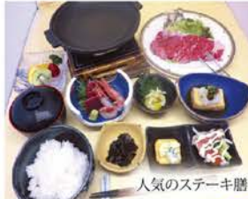
人気のステーキ膳